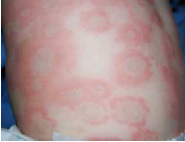
4. « » [10].